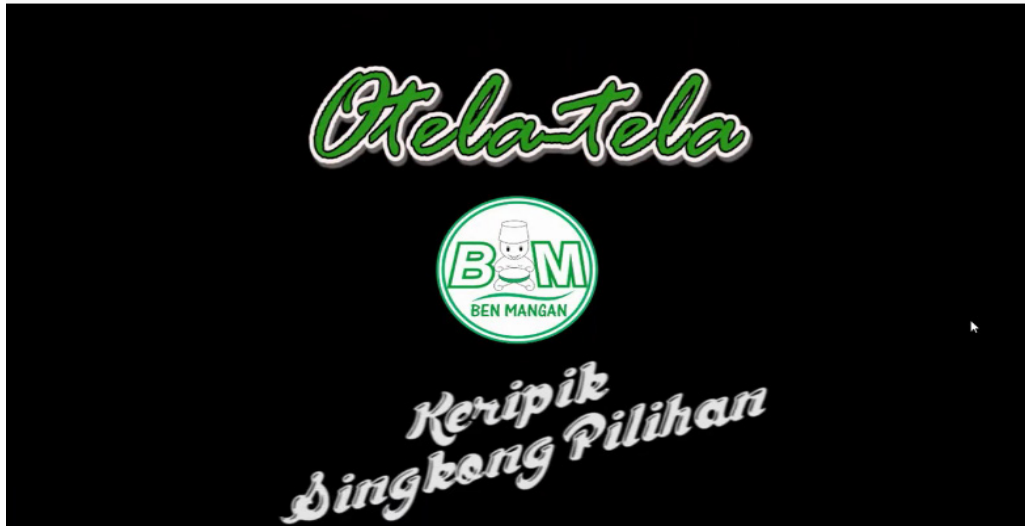
Gambar 3 Hasil Editing Video Iklan

Pada gambar diatas terlihat sebuah susunan beberapa potongan gambar yang berada di kolom sebelah kiri yang akan di edit menjadi sebuah video iklan yang utuh. Proses selanjutnya memilih potongan gambar yang akan digunakan dan disusun menjadi sebuah video yang utuh agar iklan tersebut dapat disaksikan oleh penonton nantinya. Selanjutnya potongan gambar dan video disusun sebaik mungkin agar nantinya editor akan menambahkan beberapa efek seperti suara, teks dan efek lainnya. Tujuan dalam penambahan efek tersebut agar video iklan yang telah dibuat dapat memberikan kesan estetis dan indah bagi yang melihat nya. Sementara hasil akhir dalam pengeditan video iklan dapat dilihat pada potongan gambar sebagai berikut.