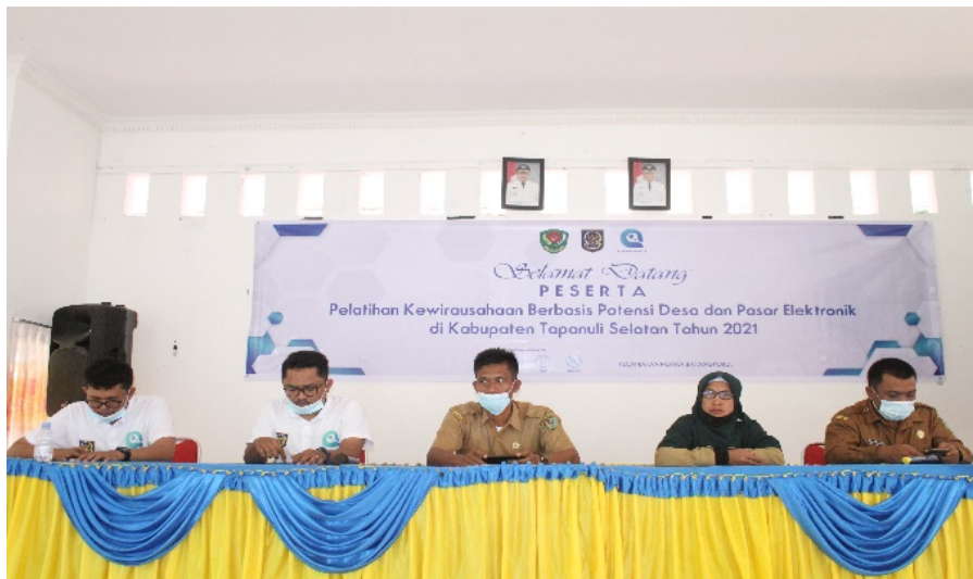
Gambar 2 Pembukaan Kegiatan Oleh Perangkat Kecamatan

Berdasarkan hasil evaluasi pada tabel 2 diatas secara keseluruhan peserta memberikan tanggapan positif terhadap pelatihan yang dilaksanakan. Hal ini terlihat dari 73.57% peserta memberikan tanggapan sangat setuju atas pelaksanaan pelatihan dan 24.28% peserta yang memberikan respon setuju da hanya 2.14% yang kurang setuju dan tidak ada peserta memberikan respon tidak setuju dengan pelaksanaan pelatihan ini.