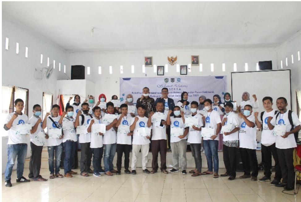
Gambar 4 Foto Bersama Peserta Pelatihan