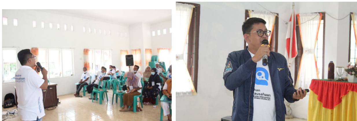
Gambar 3 Penyampaian Materi Pelatihan