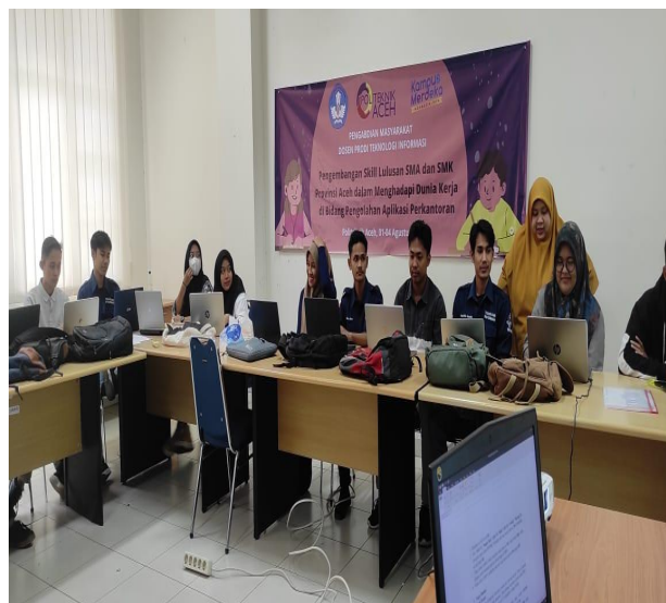
Gambar 2 Kegiatan PKM Pada Hari Pertama

Pembukaan pelatihan yang dihadiri oleh peserta alumni Sekolah Menengah Atas dan Sekolah Menengah Kejuruan pada beberapa sekolah di Provinsi Aceh. Ketua program studi di Teknologi Informasi membuka sesi pelatihan dengan berdiskusi bersama peserta pelatihan, hal ini berfungsi