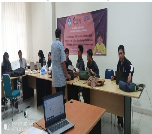
Gambar 1 Pembukaan Pelatihan PKM

Pelatihan Aplikasi Perkantoran (Microsoft Excel dan Power Point) dilaksanakan selama tiga hari mulai tanggal 3-5 Oktober 2022 pukul 09.00 – 16.00 WIB. Pelatihan ini diikuti oleh ±20 peserta yang turut serta melibatkan mahasiswa yang diperbantukan untuk membantu pemateri dalam memberikan arahan pada peserta. Hari pertama pelaksanaan pelatihan, siswa sangat antusias untuk hadir dengan jumlah peserta sebanyak 20 orang, pembukaan hari pertama dibuka langsung oleh Kepala program studi Teknologi Informasi Politeknik Aceh.